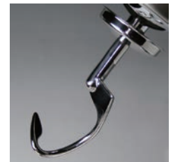
ステンレスフック (op)