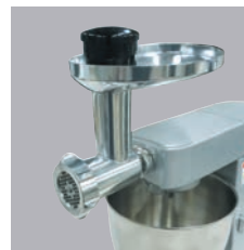
スーパーミキサー (op) (ソーセージフィラー付) KAX950ME