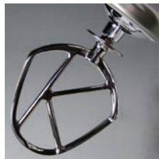
ステンレスビーター (op)