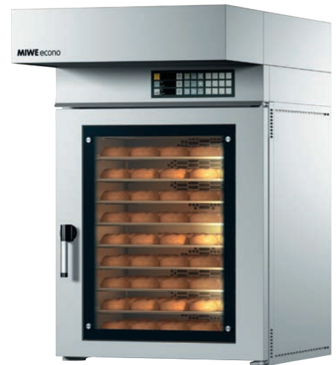
EC 10.0604 スチームフードファン仕様 (オプション)