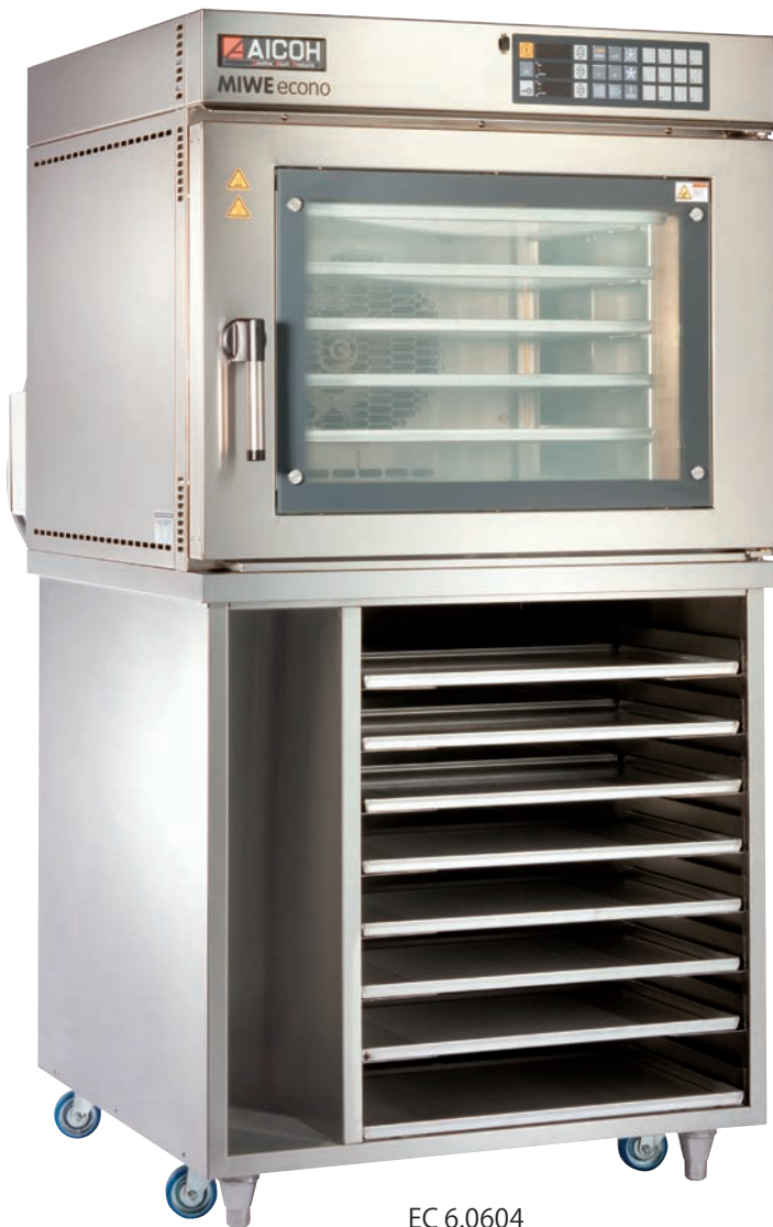
EC 6.0604 専用ラック仕様 (オプション)

焼成面積がたっぷり、スタイリッシュな外観はイン・ショップでの焼成にぴったりです。ホイロ後冷凍生地をそのまま入れて、スイッチを押すだけで焼き立てのパンを誰でも簡単に自動焼成することができます。各種製法のパン生地・冷凍生地や洋菓子の焼成などにおすすめです。