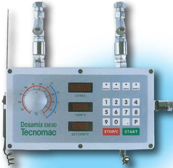
※この写真は ドーサーミックス 90 です。